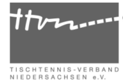
Tabelle und Spielplan

Rang Mannschaft X S U N Spiele +/- Punkte