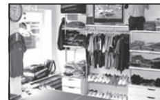
Tisch zum Testen